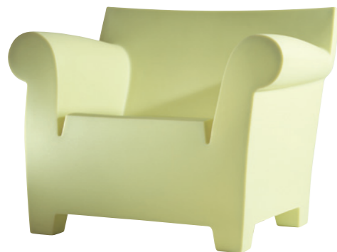
Bubble Club, Philippe Starck, Compasso d'Oro, 2001

ADI ADI ASSOCIAZIONE PER IL DISEGNO INDUSTRIALE DELEGAZIONE LOMBARDIA